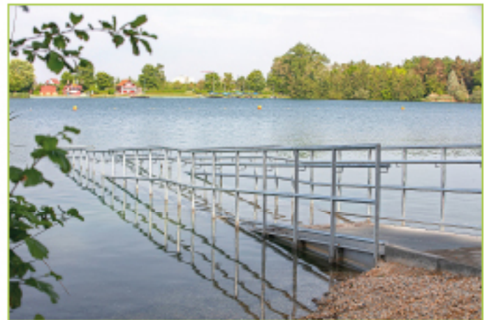
Der barrierefreie Zugang wurde rechtzeitig zur Badesaison fertiggestellt.

Bei weiteren Fragen steht Ihnen die Geschäftsstelle des Vereins für Naherholung unter Telefon 0941 4009-402 oder naherholungsverein@lra-regensburg.de gerne zur Verfügung.