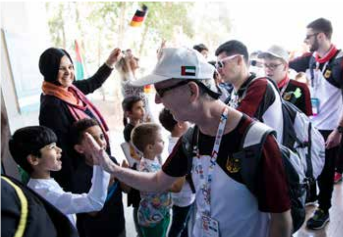
Empfang in der Deutschen Schule beim Host Town Program der World Games 2019 in Abu Dhabi

Das Projekt „170 Nationen – 170 inklusive Kommunen/Host Town Program“ läuft bei SOBY seit Juli 2021. Gefördert wird es durch das Staatsministerium für Familie, Arbeit und Soziales. Hinter der langen Projektbezeichnung steckt das Gastgeberprogramm für die ausländischen Delegationen bei den Special Olympics Weltspielen 2023 in Berlin.