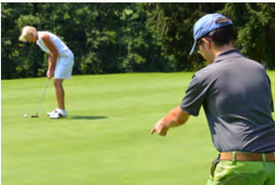
Abgeschlag – Charity-Golfturnier