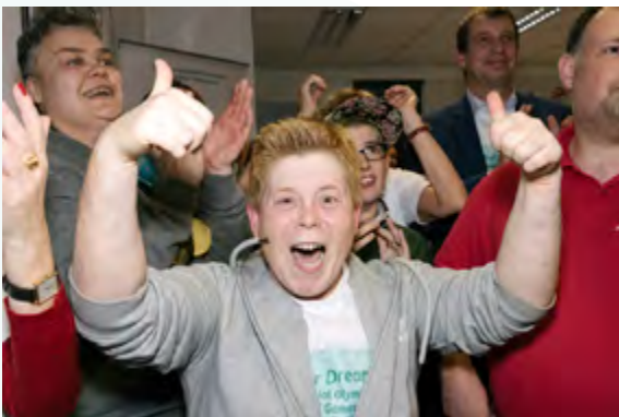
SOBY News – Special Olympics World Games 2023 in Berlin!