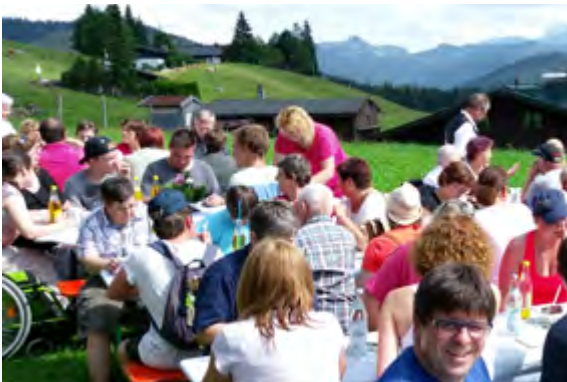
Der Inklusionsverein Chiemgau e.V.