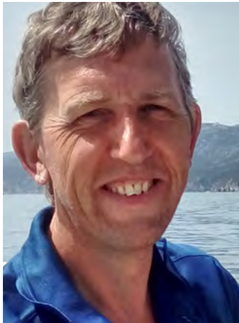
„Ich bin seit 2017 bei SOBY aktiv und eines meiner Ziele ist der Aufbau einer Langlaufmannschaft“

Bei Special Olympics Bayern engagiert er sich seit 2017. Insbesondere in der Sportart Ski-Langlauf war er schnell als erfahrener Ratgeber eine wichtige Ergänzung bei Aktivitäten von SOBY in Reit im Winkl. „Mit Special Olympics Bayern bin ich über meinen