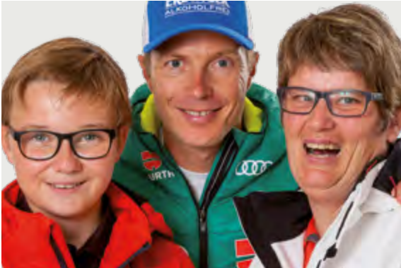
Die Gesichter der Winterspiele