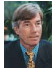
S.k.H. Prinz Leopold von Bayern