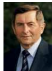
Alois Glück Bayerischer Landtagspräsident a.D.