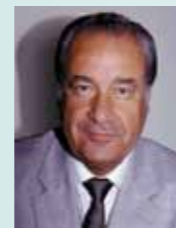
Manfred Schnelldorfer Olympiasieger, Weltmeister