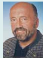
Klaus Wolfermann Olympiasieger