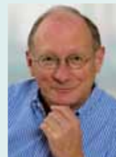
Franz Maget Landtagsvizepräsident a.D.