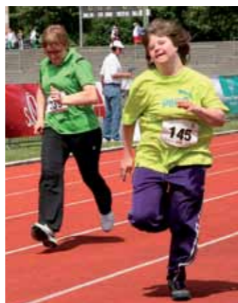
Abbildungen links: Impressionen aus den letzten 10 Jahren