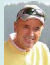
Christian Neureuther 6-facher Weltcupsieger