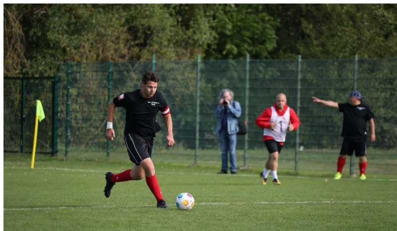
Fußballturnier bei Landesspielen Weißenfels 2023

Ich will gewinnen, doch wenn ich nicht gewinnen kann,